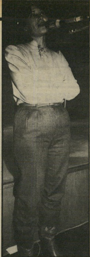
מישנה-ליועץ קרם תוצאות מדאיונות

על "השאלה הדמוגרפית": "כבר יצחק טבנקין אמר: צריך כל מיני קונצים כדי לפתור את