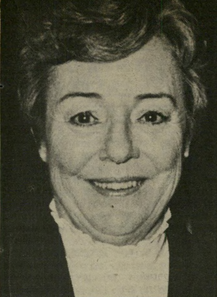
פאטרישיה היצ'קוק אבא - חי או מת?

אינני בטוח בכך. אחת הבעיות שהיו לי עם המחזה המקורי, היתה העובדה שכל הדמויות העריצו את השחקן, אבל לצופה לא היה ברור מדוע. מלשם כך הוספנו כמה סצינות - ביניהן סצינה בתחנת-רכבת - המסבירות טוב יותר את דמות השחקן ואת הכאריזמה המיוחדת שלו, והן מוסיפות גם ליצירת התחושה הנכונה השוררת בתוך להקת תיאטרון נודדת.