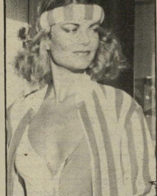
דוורנית מאריש כיסוי-ראש תואם לבגד-חורף

ההגזים ולהפריז, אך גם לא לקמץ. קשירת הטרבוש טובה ועוזרת גם בימי הקיץ על חוהיהם עם בגדיים ומישקפיים, והמראה הכללי הוא סכסי מאוד.