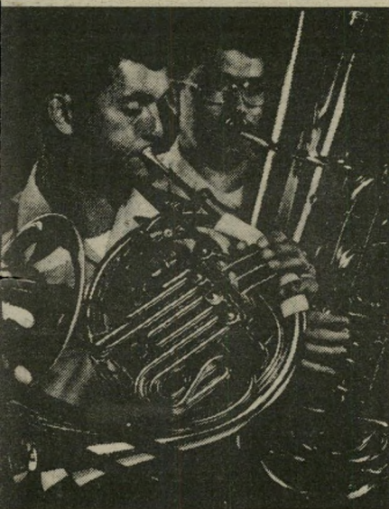
קריינר בפעולה אתגר וחשיפה

אך קיימת זיקה ברורה בין כל המרכיבים, חיצוניים ופנימיים. מסיבה זו, מובאת כאן תמונתו של נסיד, אין זה נסיד מלידה אלא זמר ניו יורקי הקרוי פרינס.