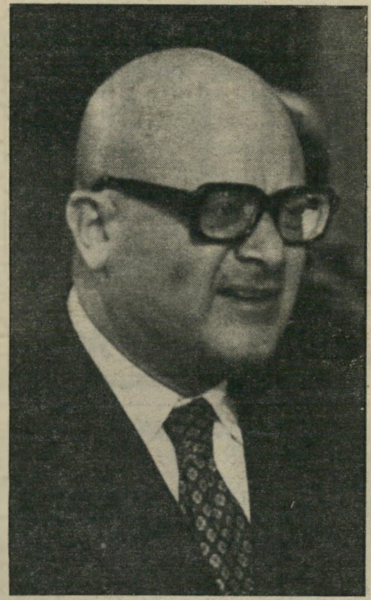
עוזר שוקן ליבראל זה ליבראל ושמן זה שמרן

לא ידוע על התפרצויות צחוק כלשהן בקרב קהל השומעים, אבל כל עיתונאי מתחיל שבקר באל-סאלברור, וזה כולל גם את העיתונאים האמריקאיים, יודע היטב שארצות-הברית שומרת בכוח צבאי על מישטר פאשיסטי, המייצג את האינטרסים שלה, ושל שלושה אחוזים מאוכלוסיית אל-סאלברור. תחת מישטר זה