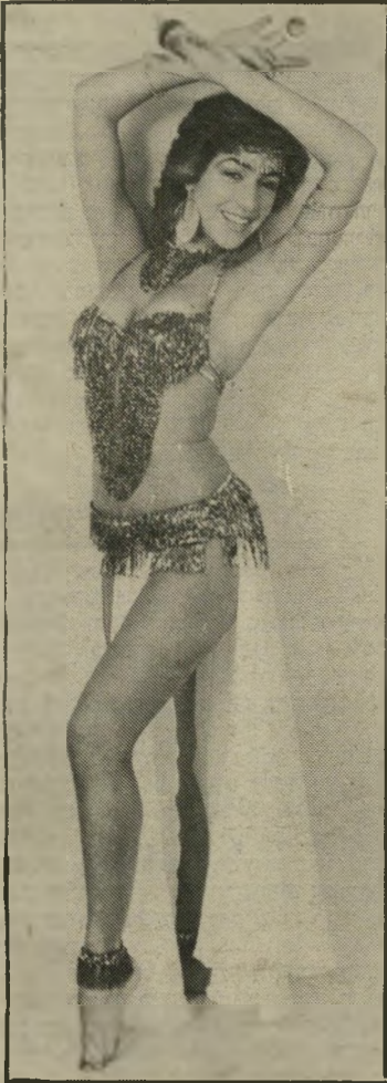
רקדנית סימון תועלת מירסומית

במדור "לילות ישראל" (העולם הזה 7.3.84) נשמט שמה של רקדנית-הבטן.