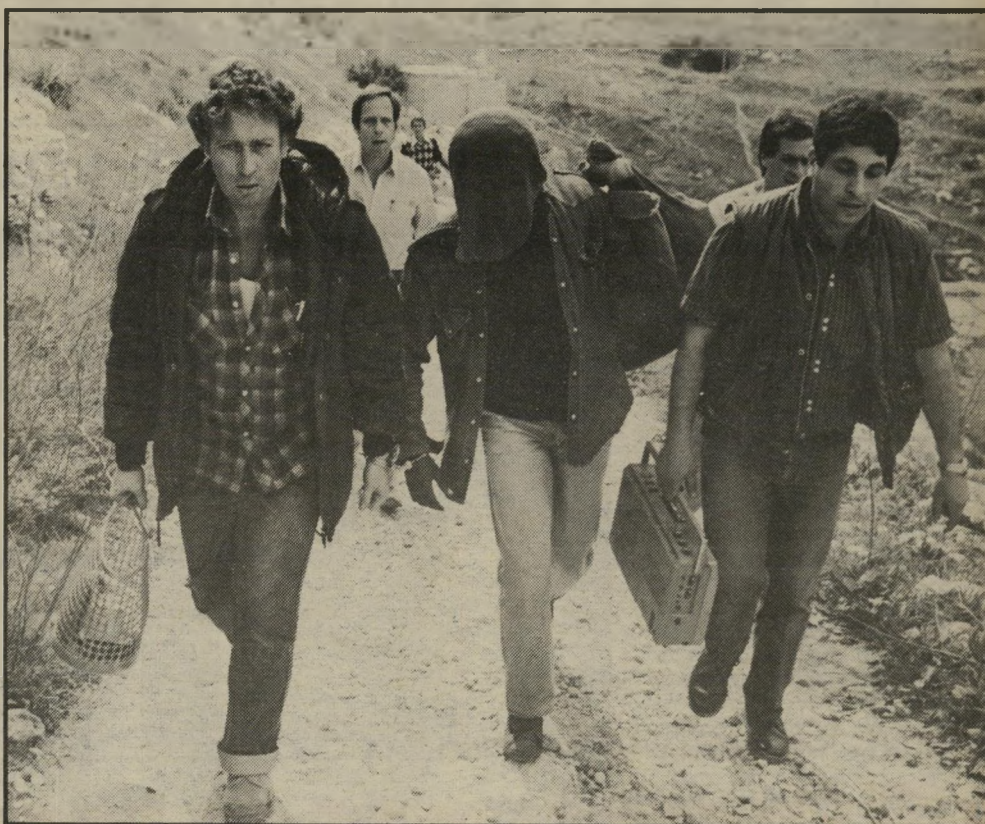
אחד החשודים מובל למחסן-הנשק סיוע של גורמים מבחון

נושא "החזרתו" של הרהיבת לירייה יהודית אינו חדש והוא עולה מדי כמה חודשים מאז הכיבוש של 1967, כאשר החרדים הקיצוניים מנסים בכל דרך, אפילו אלימה, לקבוע עובדות בשטח. במעשיהם הקיצוניים