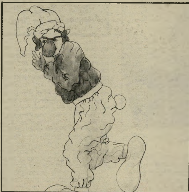
תחפושת דרדרים הכי לוחטת בעיר

הגורה עם ניטים. מראה הגל החדש הוא באופנה. יש הנראים כך כל ימות השנה, ויש המעדיפים להתחפש כך ליום אחד בשנה.