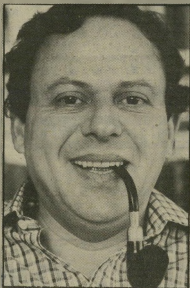
פרופסור-גאסטרונום פרי תבשיל עלוב

והשירה העברית, וחופש ההבעה העבריים — יגיעו לכאריקות.