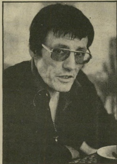
מחבר-רמות-הניגונים עימות מתוחכם

וכאשר הגיבור-המספר מתגייס לצבא, למרות היותו אח שכול, נמשכת לה האורדיסיה הזו של יצחק אורפז' בעיקבות נעוריו. ככלא צבאי עובר