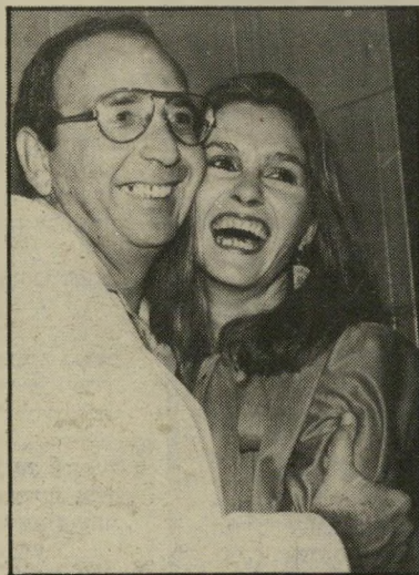
לא-יחוזר גילעדי וידידה שאלה

אין ספק שדבר-מה רקוב בממלכת רשות-השידור בעת האחרונה. דוגמה נוספת: התעלמות הנהלת רשות-השידור מהוראות שהיא עצמה מפרסמת בין כתלי הרשות. לפני כמה שבועות הפיץ המנכ"ל, יוסף לפיד, הודעה, המזהירה את כתבי הרשות (רדיו