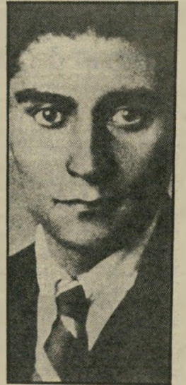
סופר קלאק יצא מהאופנה

אפילו התוכנית השאפתנית, שחברה לפני שנים אחרות על־ידי וילי בראנדט וזכתה לפירסום כלל־עולמי רחב, עומדת לפני גניזה. מאז הופעת הדוח, שחבר על־ידי צוות בראשות וילי בראנדט, ושכלל גם אישים שמרניים מתונים, כמו ראשי־משלת בריטניה לשעבר אדוארד הית', עבר על העולם הרכושני תהליך היימנה ברור. ג'ימי קארטר נעלם, רונאלד רגן ומרגרט תאצ'ר, חסרי הרגישות הסוציאלית, מושלים כיום בכיפה.