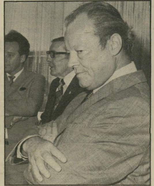
בעל תוכנית בראנדט לא פילנטרופ

אפילו גרגיר אחד. סיפרו החדש של לסטר בראון, מצב העולם ב־1984, מביא נתונים רבים, המחזקים את תחושת החירום, אותה ניסה בראנדט לעורר, לשוא. בראון מרווח שייצור החיטה לסוגיה באפריקה ירד ב־11 אחוז מאז 1970.