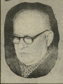
מה גרם לנפילת הבר-סמיגה של שלומון מפא"י?