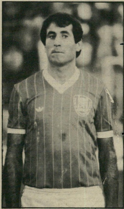
כדורגלן ארמלי המראה לפיסגת הטבלה

פנינה רוזנבלום גילתה השבוע לאנשי הכדורגל כישרון נוסף בשרשרת הכישרונות הרבגוניים שחשפה עד היום. יש לה זיקה היסטורית כמעט למישחק הכדורגל (עוד מהימים