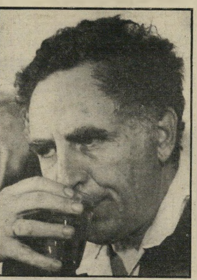
שריהאוצר כהןאורגד מה עם הפיצוי?

שהעצמאים ישלמו יותר, אנחנו השכירים הדפוקים נשלם פחות. ננקיישראל ירפיי פחות כסף, ואז, אולי, גם האינפלציה תירגע מעט. ועוד הערה כדאי להוסיף למיכתב לשריהאוצר, שייצא ביום ראשון לוושינגטון, לקבל מיפרעה, או אם תרצו מיקרמה, על חשבון הירוק החגורה שהבטיח להם, לאמריקאים, לבצע בלי נדר, אם אגודתיישראל לא תעלה את המחיר: מתי נקבל פיצוי על שחיקת השכר? פי שלוש מהשער. אני מבקש להעיר עוד הערה אחת, גם היא לקוחה מתוך מחקר שערך הד"ר זילברפרב, הכלכלן של מישרר הכלכלה והתיאום המישררי (מרירור). הוא אומר שהיקף הכלכלה השחורה בישראל הוא בין 20% ל-27%