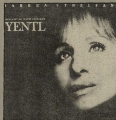
אחד, שבו משולבים קיטצ'ר שיהיה מהסרט, מרגש שהסרט עצמו אולי אינו כה גרוע, אך גם בו נדמה כי יש לראווג לדי כסף כדי לצאת בכל פעם שהיא שרה ולקנות איזה פופיקרון או שתיה.

ינטל — ספיקול הסרט של ברברה סטרייסנדר; סיביריאם אמרו לי, המילים כאן חשובות יותר מהמוסיקה, הקשב להן. מתי לאחרונה הפיק יצחק בשביס-זינגר אלבום שבו הוא שר קיטצ'ר פרוזאי אם כבר ברברה סטרייסנדר תמיד העדפתי אותה כשחקנית ולא כזמרת. המתקנת היהודית של הלחני מישל לגוראן והשמאלץ היידישי של להיטטיינר מעוררים בחילה. שאלות באנאליות כמו, "מדוע, זה אלוהים שבשמיים, מוטלות עליי, כאשר, מינבלות כה רבות? האם לא נוצר המוח כדי ליצור והישבן כדי לנוע?" נשאלות כמיסגרות מוסיקליות באנאליות עוד יותר. למישל לגוראן היו הישגים מרשימים בקולנוע כעבר, זה לא ייזכר כאחד מהם. רק כשיד