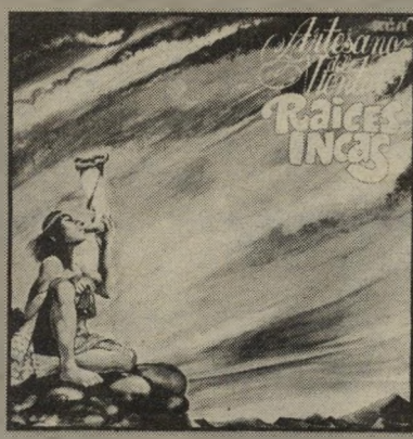
מדהים עד כמה קרוב הסינגון העממי הזה למינימליזם המודרני, עם סדרות קצב ומלודיה החוזרות על עצמן ללא הרף, אך מבלי לעשעם.

ארטסאנו דל ויינמו — שורשי האינטרנציונליזם ארבעת חברי הרכב זה הם ארגנטינאים המנגנים בכלים עתיקים מהרי האנדים. רוב הרפרטואר שלהם מורכב אף הוא מאותה מוסיקה עתיקה של בנייהאינקה, תושבי האנדים. זהו אלבום הרביעי בתורת ארטיסאנו, ומתווה סיכום תקופה בפעילותם. משום כך מוצאים כאן גם כמה נעימות יפניות, אשר אומצו על ידים אחרי סיבוב הופעות של שלושה חודשים בארץ זו. זוהי הודמנות מצויינת, דרך איכות הקלטה טובה, להכיר איכויות מקצב וצליל שאינן נשמעות תדיר באזינויננו. אפילו אל קונצרט פאסא (הגשר הלבן) וזכה כאן לביצוע העושה עימו צדק.