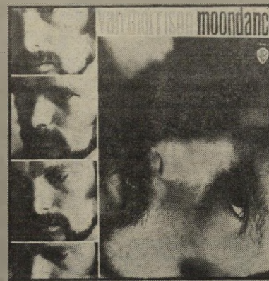
ושליו; רואים ממי למדו ג'קסון בראון וג'ון קוגר לשיר ואיך ניתן לשלב בהצלחה כמה סינגונות אמריקאיות אשר אינם ששים, בדרך כלל, להתערבב.

ואן מוריסון — ריקוד ירח; החברה הבללית למוסיקה זהו תקליט ישן, אשר מעולם לא יצא בהטבעה מקומית. אם כבר ללכת אחורה ולהטביע תקליטים אשר פיספסו את יציאתם המקורית לאור, מדוע ללכת כה רחוק, עד ריקוד ירח, כאשר רק לפני זמן לא רב יצא לאור, בעולם ובארץ, תקליט החדש של מוריסון אם המטרה היא להשלים למאוזן המקומי חורים בהשכלה, בחירה הראשונה והברורה של חברת התקליטים המקומית היתה צריכה להיות לורי אנדרסון עם מדע גדול שלה. זהו הפיספוס הגדול ביותר של הד ארצי בשנים האחרונות. לגבי תקליט זה של מוריסון — לומדים ממנו איך המרכז האמריקאי נשמע לפני שהרגיש צורך להשתמש בכמויות גדולות של חשמל ועוצמה, כשעוד היה רגוע