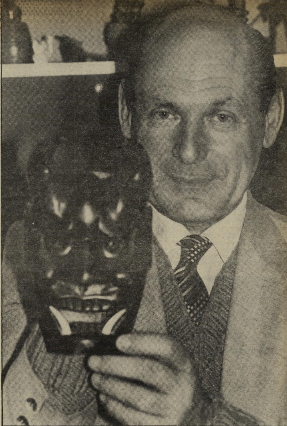
וחדים בולטים מפיו. השד הובא למאייר כמתנה. על-ידי חברים יהודעים כי שד עבור מאייר זו תשורה יקרה מאוד. היום יש לי תשעים שזים, הוא מתפאר.

"ברגע שהיו לו די שזים, הוא החליט להמשיך ולאסוף תריסר כפול תריסר, שהם 169 שזים וכאשר היו לו 169 שזים, הוא פתח את ביתו לקהל הרחב והפך אותו למוסיאון לשזים. היחיד בבעולם, בעיר קובנה בליטא." רינה ז'ק אשר בעיקבות האבתה