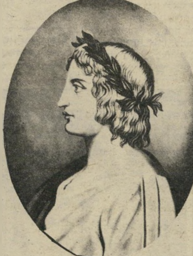
משורר וירגיליוס פנו מקום, סופרי יוון!

שים נא את חניבעל על כףהמאזניים: כמה ליבראות תמצא במנהיג גדול? זהו האיש, שאסריקה היתה קטנה מהבילו, עליאף שהשתרעה מחוסי מרוקו מוכי הים עד היאור הלהט, אל עמי האתיופים ושוב אל הפילים. לקיסרותו מצורסת ספרה, הוא הוציא את הקיסריות, מולו ערם הטבע את האלפים והשלו. הוא מבקיע הסלעים ושובר את ההר בחימוץ, והנה כבר כביש את איטליה, ובכליאת הוא מתכוון להמשיך. לא השגנו דבר, הוא אומר, כל עוד היילינו לא הבקיעו את שערי העיר ודגלנו לא הונף במרכזה של רומא. הוי מראה ראוי לציור, המנהיג שתופיעין רובב על בהמה ענקית! ומה הסוף? איי לתהלה: כי מנוצה האיש, ממחר לגלות, ושם הוא יושב ליד