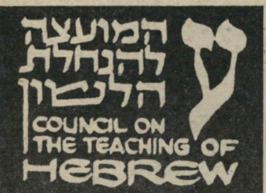
מן הסדנא מעברית מיקראית לצברית

שאינו מנצל בימה זו לטפיחה על השכם, ומעיר אף קערה, המעידה על אוולתיך מסוימת של חוקרי הלשון העברית בימינו. וכך כותב פרופסור רבין: בשאנונו סוקרים את קרוב ל-1000 הפסדים והמאמרים המופיעים כאן, העובדה הבולטת ביותר היא מיעוט המחברים המוקדשים לעברית המדוברת ורובי המחברים