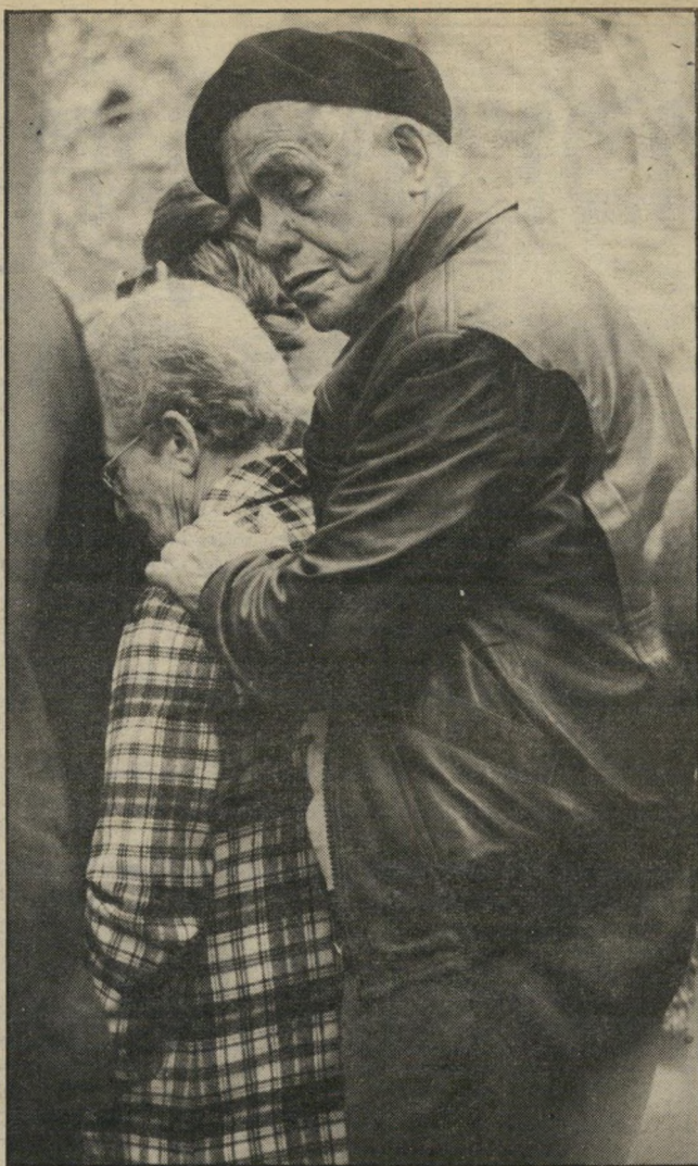
חזן מנהיג מפ"ם, יעקב חזן, בא לקבורה בבנימינה עם אשתו, שאותה הוא החזיק בשתי ידיו, כאשר הם צעדו לחלקת-הקבר. מימין: דגל המדינה שעטף את הארון, והחבל שבעזרתו הורד הארון אל הקבר מונחים על מצבה לצד הקבר הפתוח בחלקת הקבר של מישפחת הכהן.