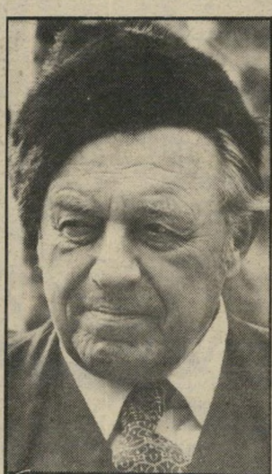
קולק ראש עיריית ירושלים, טדי קולק, הופיע בחלי-פה כחולה הדורה, בת שלושה חלקים, ובכובע-פרווה גדול וחם.