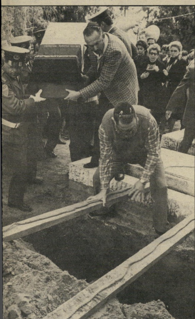
ארון מעץ ארונו של מנהיג תנועת העבודה הוותיק, דויד הכהן, מובא על-ידי מישמר הכנסת אל הקבר הפתוח. הכהן נקבר בתוך ארון-עץ שחור בחלקת הקבר המישפחתית של מישפחת הכהן.