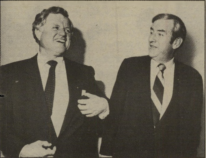
הכומר פולוול (מימין, עם הסנאטור טד קנדי) בעיקבות הקוֹקְלוֹבְסִי קלאן

חורבת-שובה לפני 30 שנה, כאשר הקשיב כמיקרה לשידור-רדיו אוואנגאליסטי. כתוצאה מאותו שידור החליט לייסד אמונה נוצרית שונה, שבה ישלב ישן וחדש, ויאחד אמונה פשוטה ופרימיטיבית (אמונה של "נוצרים על-פי הבשורה", כדבריו) עם הטכניקות המשוכללות ביותר של אמצעי-התיקשורת האלקטרוניים. עד מהרה הפך כוכב-טלוויזיה, תוך ניצול גאוני של מדרים זה. אין הוא נופל מרמתו של שר-התעמולה הנאצי, ר"ר יוזף גבלס. מדי שבוע, לרוב ביום א', ניתן לשמוע ולראות את ג'רי פולוול במאות תחנות רדיו וטלוויזיה ברחבי ארצות-הברית, כאשר הוא נושא את "בשורתו".