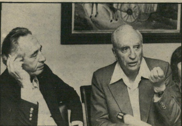
משל עם פרס לא קוטל-קנים