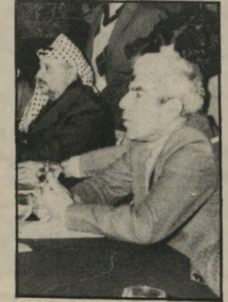
אנשי אש"ף סרטאווי וערפאת אור ירוק