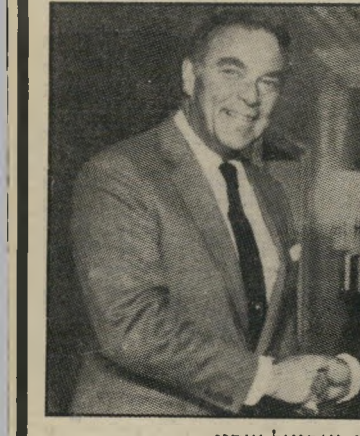
שריהוטן הייג ואריאל שרון האם הוא הלשינו?

בהתייעצות עם ערפאת החליט סרטאווי לגייס לצורך הפעולה את נשיא תוניסיה, חביב בורגיבה, שעזמו נפגש ב-21 באפריל 1982. זה אישר את היוזמה בהתלהבות. בסוף אפריל טס מוחמד מזאלי, ראש-ממשלת תוניסיה, לארצות הברית ונפגש שם עם ראשי משרד-החוץ. אלכסנדר הייג הסכים לתוכנית, שכללה שני עיקרים: סרטאווי יצהיר רשמית בשם אש"ף שהאירגון מוכן להכיר בישראל, וארצות הברית תודיע כל-יבכך התמלאה ההבטחה שנתן הנרי קיסינג'ר לישראל, שלא תנהל משאומתן עם