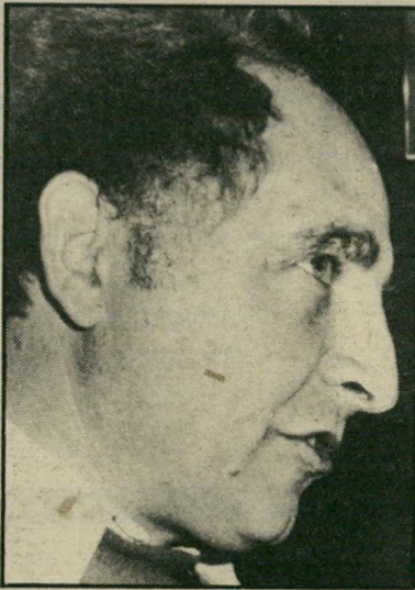
שר-אבנר אורג מה שיועד, צריך לעלות

בית, יש כלל ידוע, מה שיועד צריך לעלות וגם להיפר, הפעם הגיע התור של "לעלות". כל-כך הרבה מניות שעומדות מתחת לערך הריאלי — צריך לבוא ולקטוף. היה חסר אות-היונק והוא ניתן, ברגע הנכון ובשעה המתאימה במינון