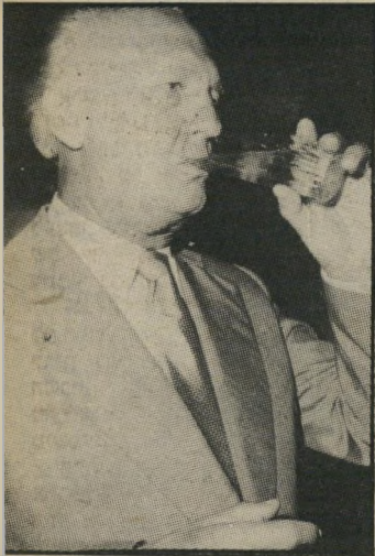
יור' בן-נתן כתב ביומן דתי

נפטרה ♦ בשולוטסוויל, ויר-גי'ניה, ארצות-הברית, בגיל 82, אנה אנדרסון מאנאהאן , אשר טענה זה 60 שנה, כי אין היא אלא הנסיכה הגדולה אנסטסיה, בתו הצעירה של צאר הרוסים האחרון ניקולאי השני. לטענת אנדרסון לא הצליחו הכול-שביקים בקיץ 1918 לשים קץ לחיי כל המישפחה הקיסרית, עת הועמדה זאת לפני כיתת-יורי בניקתת-איכרים בהרי האוראל והיא הניצולה היחידה, אשר החלימה מפצעייה כבתי אוהדי צאר