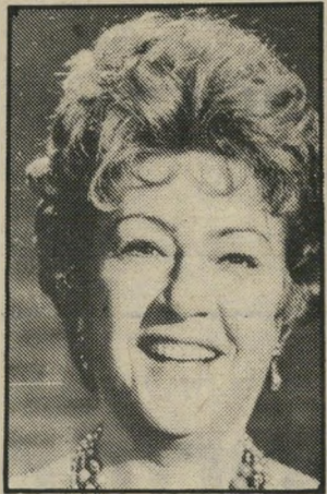
זמרת מרמן כתבת במישרד אמרגנים

הרתנה ♦ הנסיכה דיאנה (22), אשתו של יורשה-העצר הבריטי, הנסיך צ'ארלס. דיאנה אמורה ללדת את ילדה השני בסוף ספטמבר והוא יהיה, בלי להתחשב במינו, השלישי בתור לכסי-המלכות, אחרי הנסיך