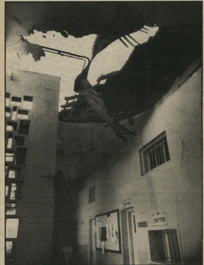
הגג השרוף של בית-המישפט ברמת-גן הפורץ בחר בדרך הקשה

לארכיון בית-המישפט. אם רצה מישוהו לשרוף את מאות התיקים הנמצאים על המדפים בחדר-המוכרות, לא היה לו כל קושי לנפץ חלון קירמי ולזרוק משם לפיד ששרוף את כל הארכיון. אולם הפורץ בחר בדרך קשה יותר. הוא טיפס על סולם מחלקו האחורי של בית-המישפט, ואת החומר הדליק הניח על הגג. מכיוון שמשם ארוכה הדרך לארכיון, לא נגרם למישרד כל נזק. מכבי-אש כיבו את השריפה בזמן, ורק לגג המיסדרון נגרם נזק קל.