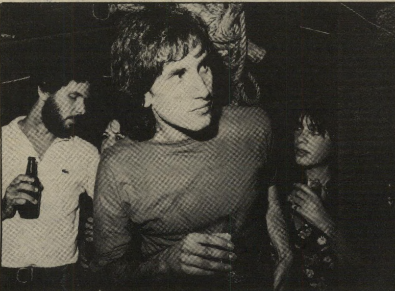
אוייב דייוויד ברוזה מייבאים אותו בחזרה בצורה משופרת...

הופיעו או המשורר אורי צבי גרינברג וח"כ התחיה גאולה כהן. אלדר, המנסה בגילגולו הנוכחי להיות ריאליסט, וכה מייד במיקלחת של צוננים מעטו של אליקים העצני. התקפתו של העצני הביאה את אלדר להכחיר את עמדותיו, דבר שעשה בנקודה (65), תחת הכותרת, לא נפלתי מהסולם": "אליקים העצני, בחריפותו, מבחין בין 'ירידה' מהסולם ובין 'נפילה', והוא קובע שמעדתו ונפלתי. "ולא היא, ירדי השגון ממני. לא נפלתי, כי כריעה צלולה ירתתי. זה נכון: אינני מדבר היום, כבימי ממת סולם, על מלכות-ישראל בין היאור והפרת, לא מכיוון שאני מתכחש לחזון. לא ניתן להתכחש למה שאיננו שלי, אלא בשרושי