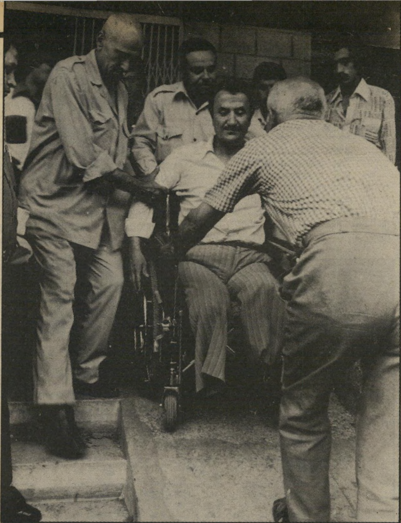
אוייב בסאם שבועה השקר אין לו רגליים!

ולומר, הנושא תפס אותי, כי אני מזדהה עם הפלסטינים... אני... בעד זה שתהיה מרינה פלסטינית בגדה' הדרגש הוא על ההורות, זו שבלב, על פיתוח חיירגש, לא מסכיב לציון ולירושלים, כי אם מסכיב לפלסטיין... ... בין תיאטרון, שבו קוטלים את הנפש היהודית להנאתם של הגויים, ובין חילול קרשיישראל בגסות בהמית ובין הסרכנות להגן על המולדת ובין, ההורות' עם הפלסטינים — יש קשר בליינתק, זו תיסמנת של סימפטומים המופיעים תמיד ביחד, ואיפיונם הוא ההתייונות, מחיקת הצלם היהודי והארץ היהודית — ביחד.