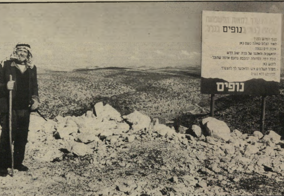
אוויר צלול, נוף משגע ותנאים אחרים לרוכשים. עדי כה הוקמו בקושי 30 שלדים של וולות. כל אחד מהרוכשים שילם כבר יותר מ-40 אלף דולר.

ה ממשלה היתה כמרחקה. סגן שר-החקלאות, מיכאל דקל, נפגש במיזנון הכנסת עם שר-האוצר, יגאל' כהן אורגד. כלי-אחד מהם נפגש עם סגן