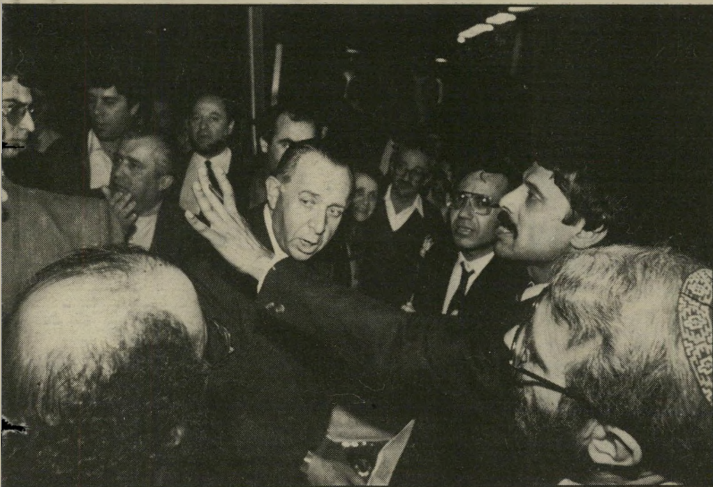
מהומה במצודה מרצה כשנודע על השתתפו בהצבעה, נסערו מאוד. באולם-הכניסה של מצודת-זאב מרצה מהומה קטנה ואף הונפו ידיים.

ממקומות שונים וכתיאום עם שלושת המוקדים בשיכונע המצביעים. אהרון, שחור ממקום מושבו