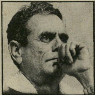
מזכיר רוזוליו ממנה הוועדה

החבר הלא-אוהד את לינסון בוועדת החקירה הפנימית של שניים, גם הוא אחד מ-28 הדייקטורים של בנק-הפועלים, מנהל סולל-בונה, שלקה, תוך כדי עבודת הוועדה בהתקף-לב, עובדה שנוצלה כדי להסביר את משך הזמן הרב וכמעט