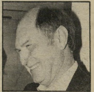
יועץ זמיר עיון בתיק

היועץ המישפטי לממשלה אשר קיבל, בזכות לחצו הבלתי-מתפשר של מזכיר ההסתדרות וי"ר חברת-העובדים, ירוחם משל, את תיק החקירה הפנימית בפרשת לוינסון. אחרי עיון בתיק במשך ימים אחדים העביר זמיר את התיק לניצב יהושע קרתי, ראש אגף החקירות במישטרת ישראל, שהעביר אותו לתת-ניצב