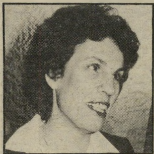
מפקחת מאור מכתב אנונימי

התפקיד הוצע ללוינסון שנית ב-1981, ערב הבחירות לכנסת העשירית, עליידי יו"ר מיפלגת-העבודה, שימעון פרס. לפי לוינסון הוא לא הרגיש בשל דיו לתפקיד בשנת 1974 ומה עוד שהיה רק בראשית הדרך שהפכה את בנק-הפועלים לאימפריה כלכלית. ב-1981 נפל העניין בגלל התנגדותו של פרס שלוינסון ינהל את ההסברה (הכלכלית, לפחות) של המערך לקראת הבחירות.