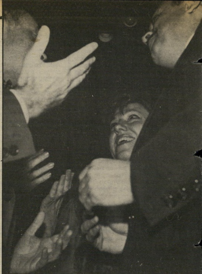
יד ליד מימין: שר-התיירות אברהם שריר עם אשתו. במרכז: מרים יד לעברו, שגריר איטליה, קארדו אטליני. הידיים האחרות שייכות למוזמנים אחרים לאירוע הנדחמים ורוצים להצטלם בכוח.