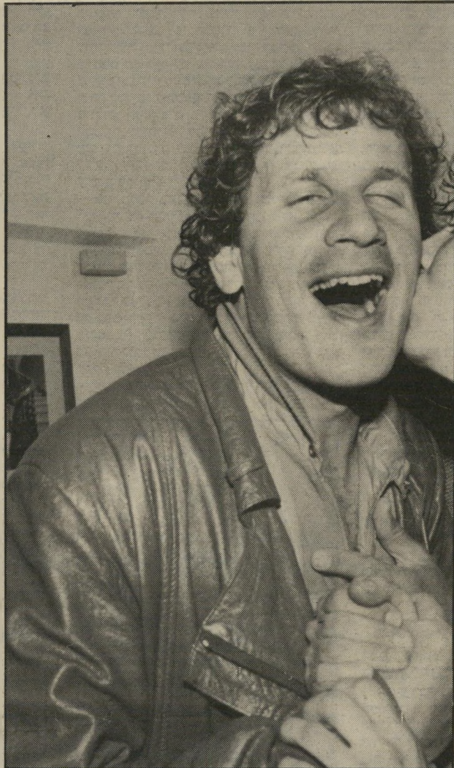
זוהרות בדרכים! השחקן דליק וולניץ בא עם חברתו יעל, אבל נשיקה הוא קיבל לא מהחברה, אלא מאחת האורחות. דליק מכבד בתשדיר המטיף לזהירות בדרכים.