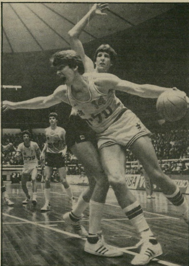
איש מכבי בריקובסקי (מכדרר)