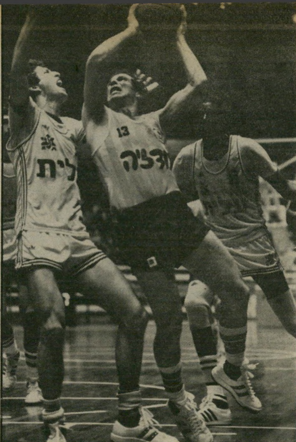
איש הפועל מוסקוביז עם הכדור