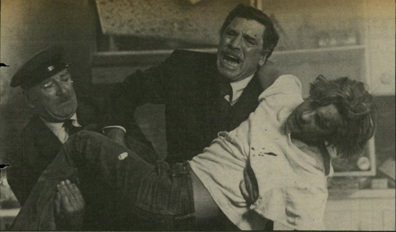
ברט לאנקסטר והלמוט ברגר בתמונה מישפחתית להתמודד פנים אל פנים עם העולם -

בעצם, קשה להחליט אם תמונה מישפחתית הוא סרט מופת או פיפסוס אדיר. קשה להחליט,