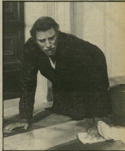
ברט לאנקסטר כמו הברדלס

להפליא, שאין בו הפתעות, הופכת את חייו של האיש על פיהם, ומחייבת אותו להתמודד פנים אל פנים עם העולם של שנות ה-70, כפי שהוא באמת.