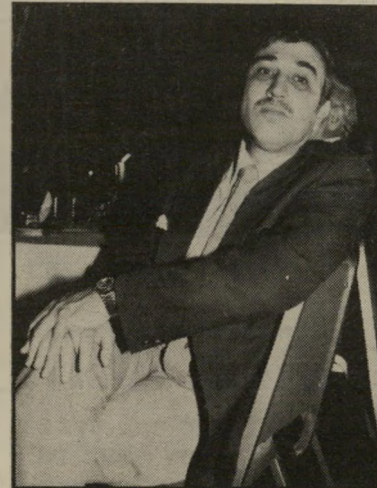
קורא שליטא הנושאים הלוקאליים

הקטנים והלחצים של האזרח הקטן, משום שרוב הח"כים מפנים שאילתותיהם לראשה-הממשלה ושר-הבטחון. כדי לזכות בתיק-שורת. על נשיאות הכנסת למצוא דרך שילובית נאותה של שתי השיטות, כדי שהנושאים