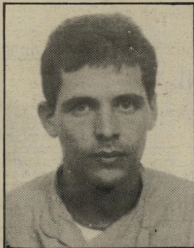
קורא גולן שרימונים לא יהיו...

היה מישהו שהפסיקה-מסיבה / השאיר נפגעים ובתוך גוויה / עמד מהצד והשליך הרימון / גרם להרג, גרם לפוגרום.