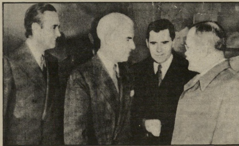
דיפלומט גרומיקו (שחור שיער) ועמיתים למיקצווע (1945)* איפה הם היו כשהקמנו מדינה?

מי זה צ'רננקו, מי זה אוסטינוב, מי זה רומאנוב