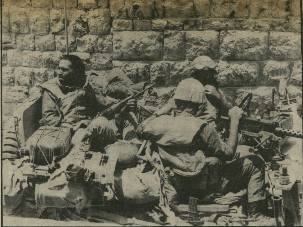
חיילי צה"ל בהמתנה בלבנון ידיעות הצריכות להדליק נורה אדומה

ללא בחל ופרק, זהו התקציר האומריכל על עטיפת ספר חדש,