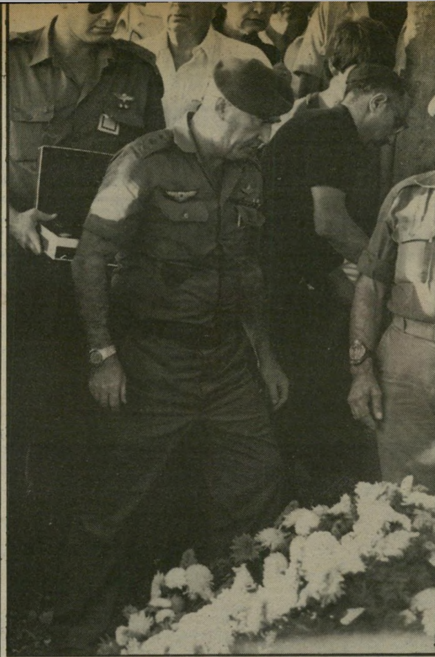
רפול בהלוויית לסקוב

גדרתי שלא אלך לשום לווייה. ביום של לוויית נכסתי לשק-חשינה..."