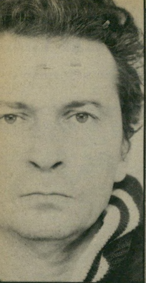
נאשם אבן מעקפק באידיאלים של המיפלגה

העוול כזה בית-הדין הרבני אמר שזכותי לראות את הילדים שלי. ניסינו לטלפן, אבל טורקים לנו את הטלפון בפנים. אני לא בחור אלים, מה אני יכול לעשות? כלום על כל דבר עוצרים אותי. לא הכייתם, לא שברתם, השומר אומר חמישה תיקים, או זה נשמע כמו מי יודע מה? אבל בגלל שנים מהתיקים אפילו לא העלו אותי לבית-הדין. כמה הטרדות אותה באתי שעה אחרי שנגמר הגן, לקראת לילדים. יכולתי ללכת לגן, אבל לא רציתי להפריע להם שם. יכולתי