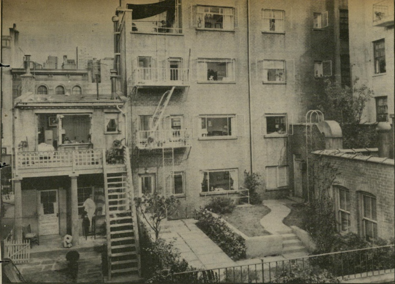
תיאורת הסרט "החלון האחורי" של אלפרד היצ'קוק מיצוי מושלם של אפשרויות הקולנוע

סרטים טובים ובין יצירת מופת. כל מי שחושד כי מדובר כאן בסריו פרטי של מבקר-קולנוע חולה נוסטאלגיה, מוזמן ללכת