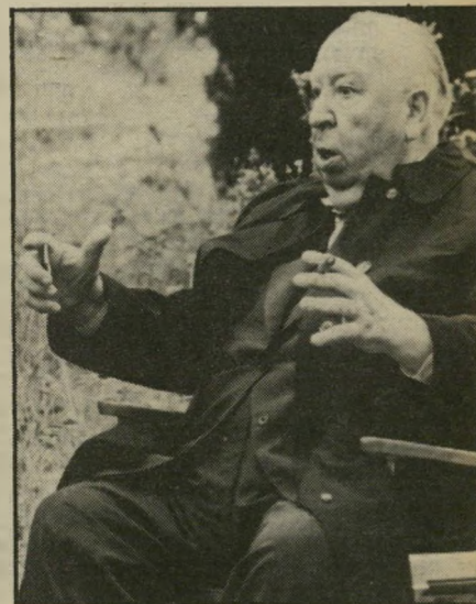
בימאי היצ'קוק קצה הקרנון

החל בשבוע הבא, הסרט הטוב ביותר שיוצג בתל-אביב, יהיה בן 32 שנים ושמו החלון האחורי. אין זו ביקורת על הסרטים האחרים המוצגים בעיר, אלא קביעה פשוטה המפרידה בין