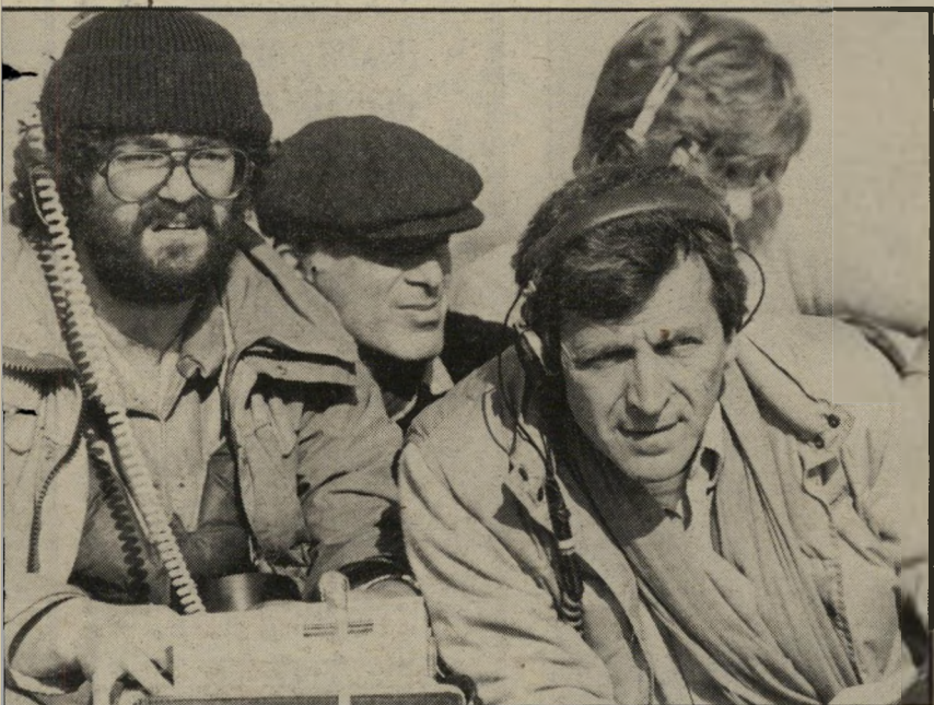
קוסטא גאבראס בעת ההסרטה של "חנה ק"

כך, למשל, לא נסעתי לפני 10 שבועות, שמרתי על טווח ביטחון, לא נהגתי בלילה, והאמת? קיוויתי שיתפסו אותי.