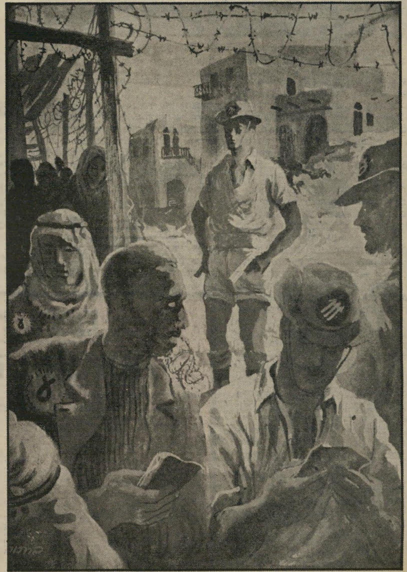
"אחריו בנימין": איור של שמואל בק (דיכוי ערבים) לפני 29 שנים והיום