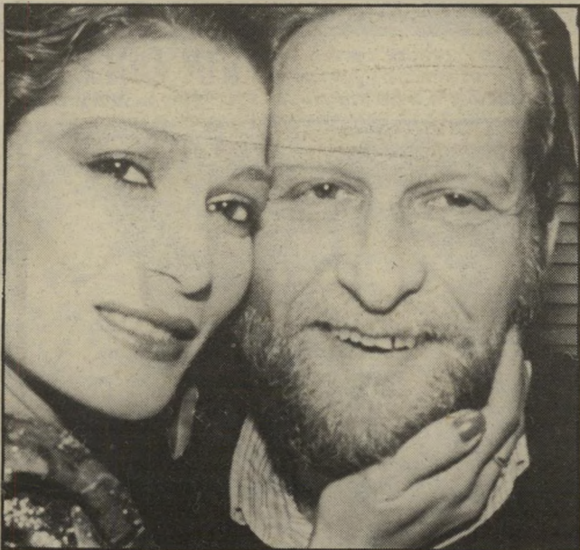
מעצב פרוביזור וידידה השלמה להופעת האשה

יתרון נוסף הוא שאת החליפה אפשר תמיד ללבוש עם איזה מעיל פרווה תואם, ואת השיכמיה אפשר לנצל לשעות הבוקר ואחר-צהריים גם עם אוברול ספורטיבי מתחתיו. יתרונה של השיכמיה בהיותה אלגנטית וגם ספורטיבית, תלוי בטיב הבד, במה שלובשים מתחתיה ובאביזרים, כמו נעליים, כובעים ועגילים אשר מוסיפים לבגד. מחיר שיכמיות-