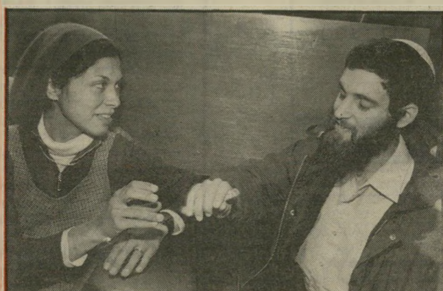
נאשם סיגל ואשתו — זוהי בדיחת השנה!

— וככל נאשם במדינה דמוקרטית, מותר להם לטעון כך ולנסות לשכנע בכך את השופטים. אך גם מי שנאשם בטעות ברצח ילדה, אינו יכול לראות בכך בדיחה. כי במרכז המישפט מצוי קבר של ילדה קטנה, חפה מכל פשע, שנורתה על-ידי רוצח נתעב כרם קר. מי שמסוגל לראות בכך בדיחה — יש לו חושיהמור מיוחד מאורמאור.