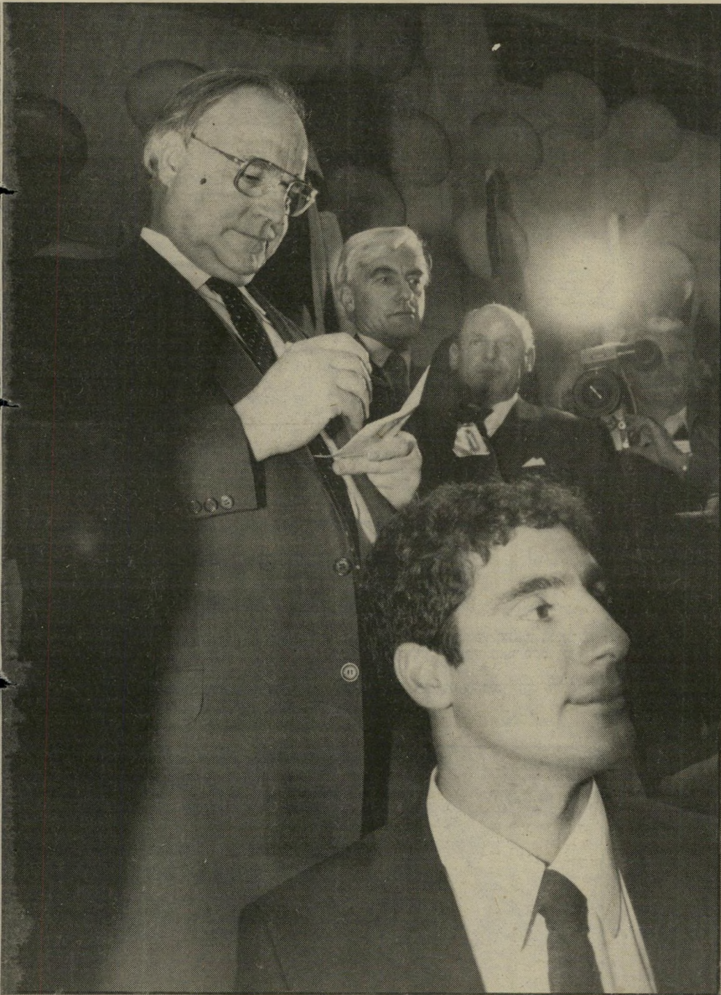
פניו. הקאונצ'ר עמד במשך שעה שלמה וחילק את חתימתו לכל דורש. למטה: המוניים נדחפים לקבל את החתימה. מימין: חתימתו של הקאונצ'ר קול.

חתימת הסופר-סטאר הקאונצ'ר הלמוט קול חותם את שמו על ההזמנות שהגישו לו מקבלי