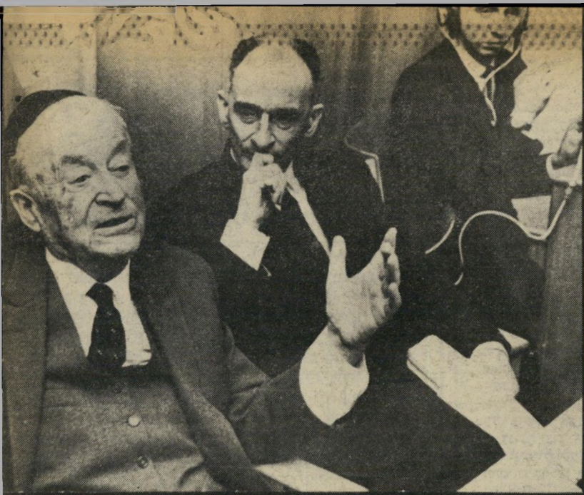
סופר עגנון הבולט והחשוב

מהפכה מופלאה, מתוך שורשי סיפורת ההשכלה. תחת הכותרת 'זאנר ואנטי-זאנר' בארץ-ישראל סוקר שקד צירות של משה סמילנסקי, נחמה פוחצ'בסקי, מאיר וילקנסקי, יצחק לואידור, י' שמו, יהודה בורלא, יעקוב הורגין, א' אריאלי-אורלוף, דוב קמחי, א' ראובני.