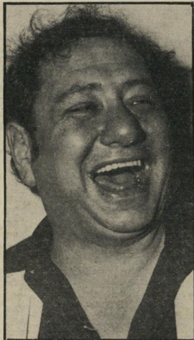
חוקר שקד מלכודת הספר השלישי

כימים אלה ראה-אור כרך שני, הסיפורת העברית - בארץ ובתפוצה (**), המתייחס לתקופה של התבססות ארץ-ישראל כמרכז של הסיפורת העברית בתקופה שבין שתי מילחמות-העולם, ומעט קודם.