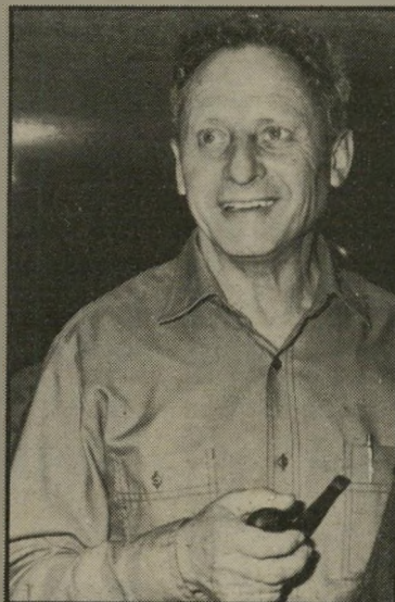
סופר מגר זכיות לסיפורת העברית

הפרט האחד, שהיה חסר לי בראיון שהעניק פטרסון לאייל מגר, היה בנוסחה מתברר האלמתי של התנדך - כתב את ספריהם אצלי ברנטון.