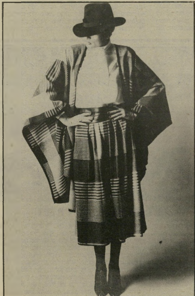
קשמיר משובץ עיצב עורך פרוביוור. מערכת של חצאית־קפלים באורך 7/8 ושאל־צעף תואם. הסט הוא אכסקלוסיבי ונמכר עכשיו בחצי־מחיר, ב־150 דולר.