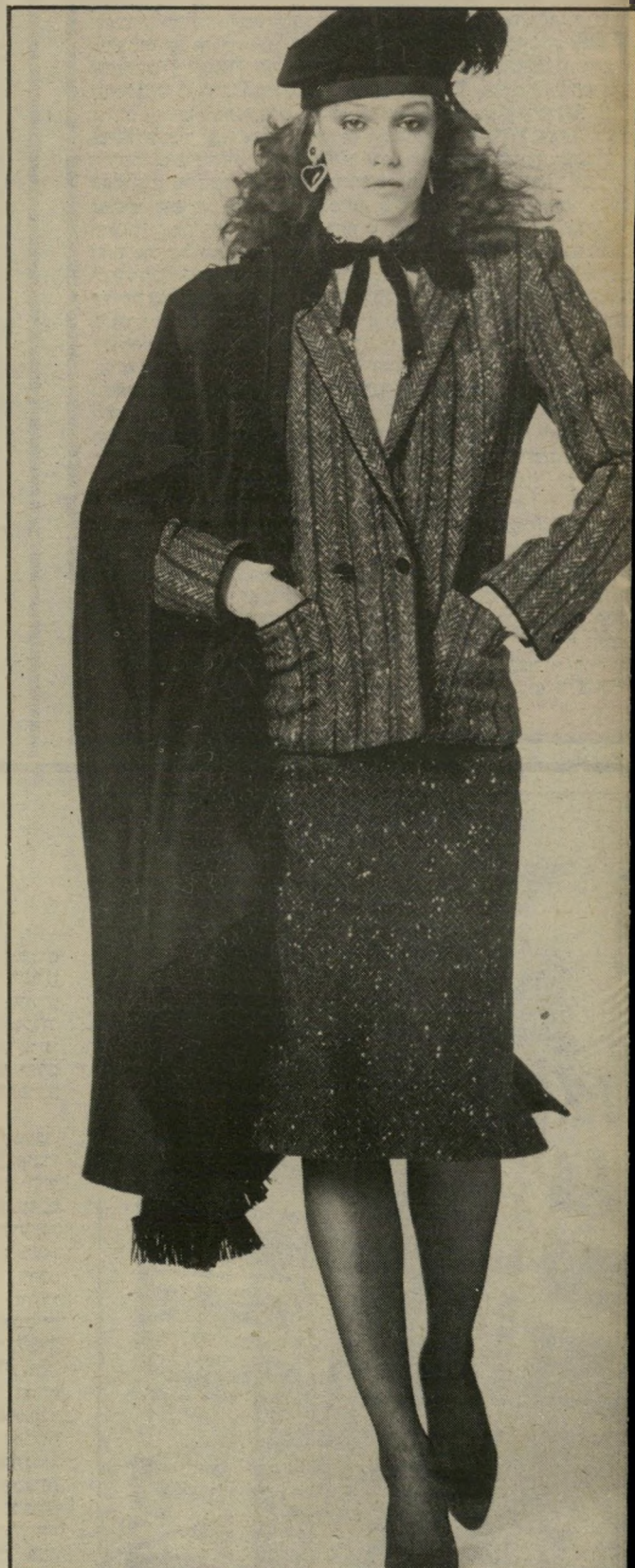
טויד מכארים חלימה מחוייטת בעיצובו של ז'אן־לואי שרר, שלה התאים מעיל־שיכמיה מבד צמר נקי, בצבע שחור. הוא אלגנטי ומתאים גם, ובעיקר, לשעות־הערב.

התיק, לנהוג במכונית, להחזיק את התינוק או את הכלב. השיכמיה היא אחד הפריטים המתאימים ביותר לאקלימנו, וזאת משום קלות מישקלה. באירופה לובשות נשים רבות מעלי־צמר קצרים וארוכים. בארצנו, שבה גם החורף לא תמיד חורף גשום וזועף, וישנם ימים נעימים רבים, משמשת השיכמיה כמעיל קליל, מחמם ואופנת, אשר נלבש על חולצת־משי, סוודר, שימלה או חליפה. אלגנטיות וספורטיביות. מעצב אופנת־העלית עורך פרוביוור דואג כל שנה שבקולקציית הבגדים