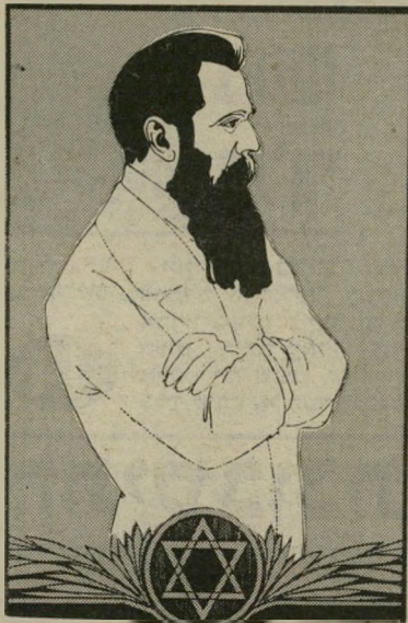
חזוה מדינה הרצל להיחר מהדתיים