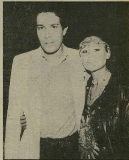
קוראה שי יזמר מסורה הופעה מלהיבה

האו וסיאו ברשותנו כלבת טוקסטרייר גיזעית, באסט גיזעי, וכן כלבים מעורבים נחמדים ובריאים, וגם התולים. נא לפנות לאגודת צעריבעליחיים, סלמה 50, יפו, טל' 03-827621. צעריבעליחיים בישראל