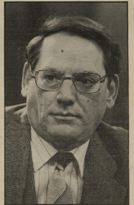
מנחה עברון האם יהודי גרמניה כיבדו את חוקי-נירנברג?

לעולם קטן נודע, ששגריר דרום-אפריקה הוזמן להופיע בתכנית זה הזמן מבלי שהופעל לחץ מלמעלה. כלומר, היתה זאת יוזמה עיתונאית של מפיקי התוכנית, חרף אי-הנחת העקרונית