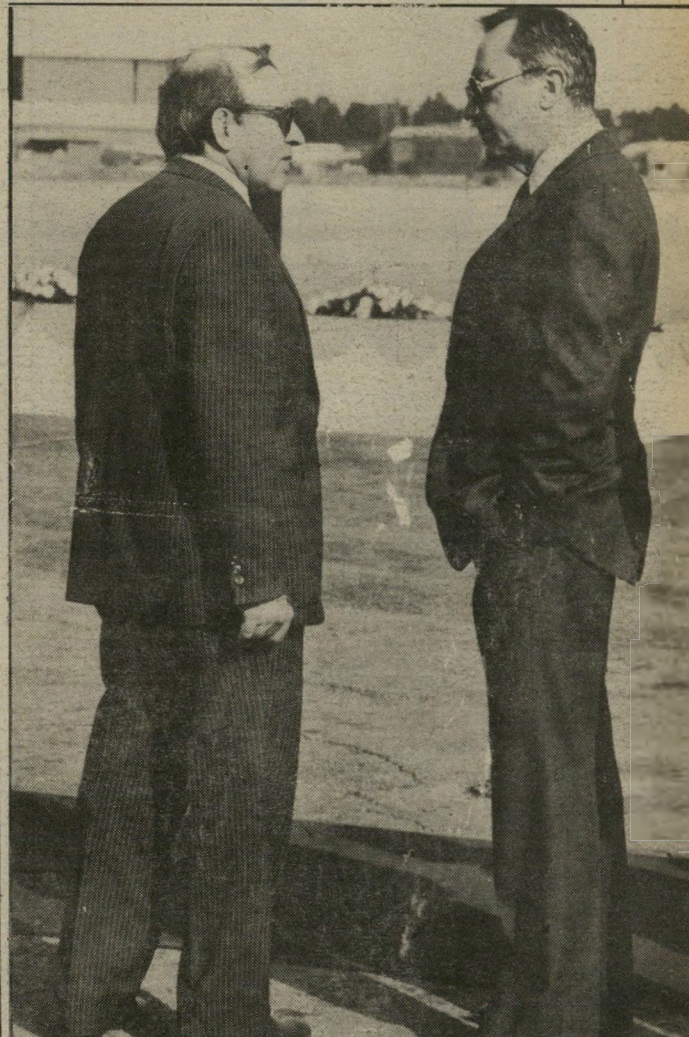
יובל נאמן שר-המדע מנהל שיחה חשאית עם שר-הביטחון משה ארנס, לפני בואו של הקנצלר הגרמני לנמל-התעופה בן-גוריון. השניים שוחחו ארוכות.