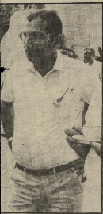
עוזר שלום הולכים שולח

בינתיים הוא הספיק להסתבך בשלל פרשיות אחרות (העולם הזה